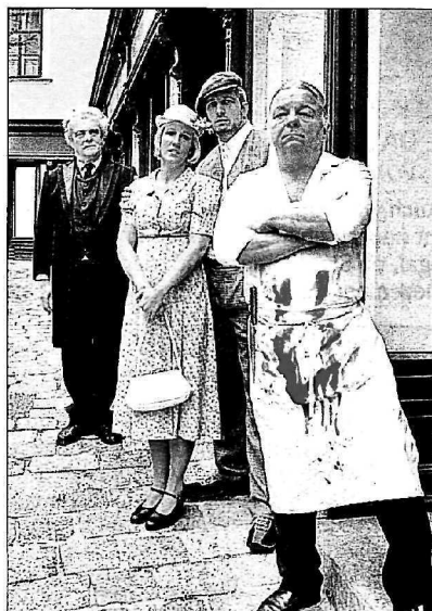
„Geschichten aus dem Wienerwald“ im Steinbruch Dambach in Purkersdorf um 20.30 Uhr. Infos: www.theater-purkersdorf.at

„Mini MAK: Minimal - ganz einfach!“ am So 11 Uhr im Museum für angewandte Kunst, 711 36/0.