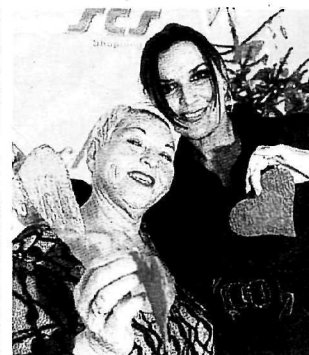
„Herzenswunschbaum“ von Entertainerin Jaz Gitti.