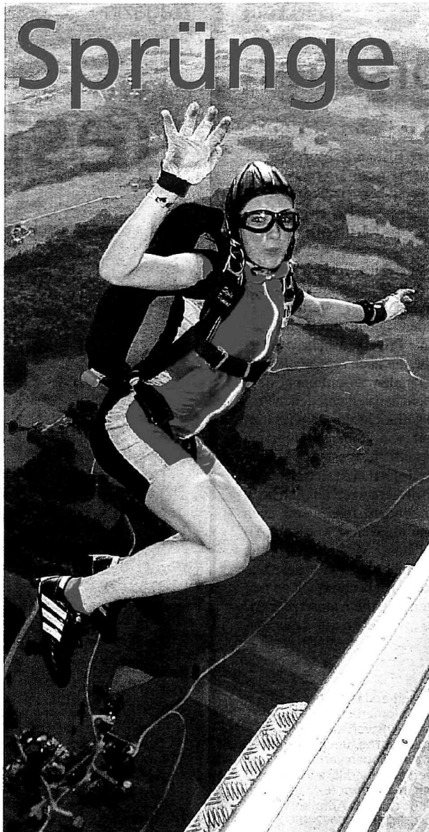
PRÄZISION UND MUT GALT ES FÜR DIE FALLSCHIRM-SPRUNG-WELTCUP-TEILNEHMER ZU BEWEISEN. So manchem erscheint bereits die Höhe schwindelerregend. Die Sportler aber mussten nicht nur aus einer Höhe von 1.000 Metern abspringen, sondern auch einen Zielkreis mit einem Durchmesser von nur drei Zentimetern treffen. Der Dame auf dem Foto dürfte es nicht nur wegen der nicht vorhandenen Beinbekleidung luftig zumute gewesen sein ...