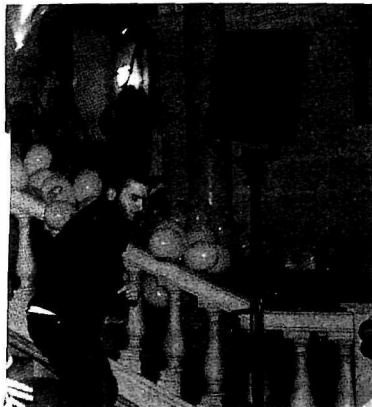
Event nach Wien.