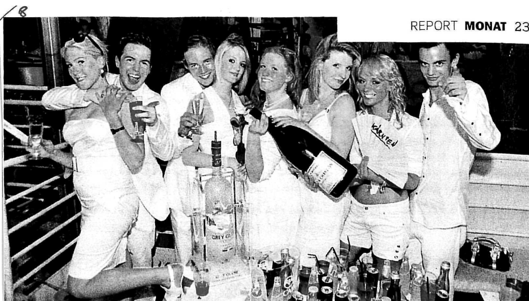
REPORT MONAT 23