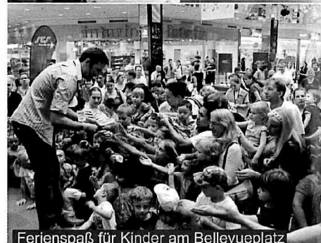
Ferienspaß für Kinder am Bellevueplatz

Im Center selbst haben wir die Wohlfühlatmosphäre weiter verbessert mit zahlreichen Neuerungen. So haben wir 2 weitere Ruhezone, eine interaktive Kids Zone, 20 neue Sitzbänke (statt alter Holzbänke) eingeführt. Es wurden die Gänge der neuen WC-Anlagen verkleidet in Anlehnung an unsere Bezirke und somit hat jedes WC einen Namen a la Park, Zoo oder Cat Walk .