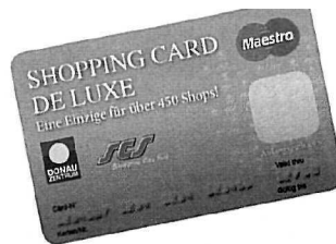
Das ideale Weihnachtsgeschenk: Die neue SHOPPING CARD DE LUXE

und andererseits bei Eingang 5, wo wir die alten Stiegenaufgänge weggerissen haben und durch neue Rolltreppen ersetzt haben. Im Zuge dieser Arbeiten haben wir sowohl den Bodenbelag getauscht als auch die Deckenöffnungen sowie Balustraden verändert. Die Staubwände während des Umbaus wurden durch spezielle Umbausujets behübscht und gleichzeitig dienten diese