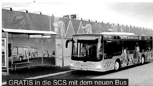
GRATIS in die SCS mit dem neuen Bus

Wir hatten ab August zwei Großbaustellen im Center, einerseits bei Eingang 4