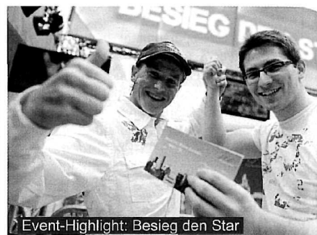
Event-Highlight: Besieg den Star

Die Bilanz der SCS kann als sehr erfreulich beurteilt werden und ich bin sehr stolz, dass es uns gelungen ist - trotz nach wie vor unbeständiger Wirtschaftslage sowie laufender Umbaumaßnahmen im Haus - sowohl die Zahl der SCS Besucher als auch das Umsatzniveau gegenüber dem Vorjahr zu steigern. Wir haben hinsichtlich Branchenmixoptimierung das Tempo von 2009 nahtlos gehalten und auch 2010 weiter attraktiviert. Neue Shops wie Bershka, Högl, Okado, Gooix, Accessorize, Cinnabon, Stiefelkönig, Billy Jeans, Freshi, Butlers, Ernstings Family, WE sind neu gestartet. Daneben haben bestehende Shoppartner umgebaut und sich mit neuem Shopkonzept präsentiert wie z.B. Fussl, Niedermeyer oder YoungStyle .